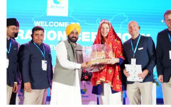
ਆਲਮੀ ਪੱਧਰ ਉੱਤੇ ਪਸ਼ੂਆਂ ਦਾ ਫੀਡ ਬਣਾਉਣ ਦੀ ਕੁੱਲ ਸਮਰੱਥਾ 120 ਲੱਖ ਟਨ ਹੈ। ਮੁੱਖ ਮੰਤਰੀ ਨੇ ਕਿਹਾ ਕਿ ਇਹ ਅਤਿ-ਆਧੁਨਿਕ ਪਲਾਂਟ ਪ੍ਰਦੂਸ਼ਣ ਮੁਕਤ ਤਕਨਾਲੋਜੀ ਨਾਲ ਲੈਸ ਹੈ, ਜੋ ਵਧੀਆ ਵਾਤਾਵਰਨ ਸਿਰਜਣ ਵਿੱਚ ਮਦਦਗਾਰ ਹੋਵੇਗਾ। ਉਨ੍ਹਾਂ ਕਿਹਾ ਕਿ ਇਹ ਸੂਬੇ ਲਈ ਇਤਿਹਾਸਕ ਦਿਨ ਹੈ ਕਿਉਂਕਿ ਇਕ ਹੋਰ ਬਹੁਕੌਮੀ ਕੰਪਨੀ ਨੇ ਇੱਥੇ ਆਪਣਾ ਕੰਮਕਾਜ ਅਤੇ ਮੈਨੂਫੈਕਚਰਿੰਗ ਸ਼ੁਰੂ ਕੀਤੀ ਹੈ। ਭਗਵੰਤ ਸਿੰਘ ਮਾਨ ਨੇ ਕਿਹਾ ਕਿ ਪੰਜਾਬ ਵਿੱਚ ਟਾਟਾ ਸਟੀਲ ਤੋਂ ਬਾਅਦ ਇਹ ਦੂਜਾ ਵੱਡਾ ਨਿਵੇਸ਼ ਹੈ। ਇਸ ਤੋਂ ਇਲਾਵਾ ਵਰਬਿਓ, ਪਲਾਂਟ, ਜੇ.ਐਸ.ਡਬਲਯੂ. ਪਲਾਂਟ, ਪਿੰਡ ਪੂਰੀ ਤਰ੍ਹਾਂ ਭੁੱਝ ਗਏ, ਜਿਸ ਕਾਰਨ 20 ਲੱਖ ਲੋਕ ਪ੍ਰਭਾਵਿਤ ਹੋਏ ਅਤੇ ਤਕਰੀਬਨ ਪੰਜ ਲੱਖ ਏਕੜ ਰਕਬੇ ਵਿੱਚ ਫ਼ਸਲਾਂ ਪ੍ਰਭਾਵਿਤ ਹੋਈਆਂ। ਭਗਵੰਤ ਸਿੰਘ ਮਾਨ ਨੇ ਕਿਹਾ ਕਿ ਹੜ੍ਹਾਂ ਕਾਰਨ 60 ਜਾਨਾਂ ਚਲੀਆਂ ਗਈਆਂ ਅਤੇ ਸੱਤ ਲੱਖ ਤੋਂ ਵੱਧ ਲੋਕ ਬੇਘਰ ਹੋ ਗਏ। ਇਸ ਨਾਲ ਸੂਬੇ ਵਿੱਚ ਬੁਨਿਆਦੀ ਢਾਂਚੇ ਦਾ ਵੱਡੇ ਪੱਧਰ ਉੱਪਰ ਠੁਕਸਾਨ ਹੋਇਆ। ਮੁੱਖ ਮੰਤਰੀ ਨੇ ਕਿਹਾ ਕਿ 3200 ਸਰਕਾਰੀ ਸਕੂਲ, 19 ਸਮਾਨਤਾਵਾਂ ਹਨ। ਉਨ੍ਹਾਂ ਕਿਹਾ ਕਿ ਇਸ ਅਹਿਮ ਪ੍ਰਾਜੈਕਟ ਰਾਹੀਂ ਪੰਜਾਬ ਨੂੰ ਵੱਡਾ ਫਾਇਦਾ ਮਿਲੇਗਾ। ਭਗਵੰਤ ਸਿੰਘ ਮਾਨ ਨੇ ਉਮੀਦ ਜਤਾਈ ਕਿ ਇਸ ਅਤਿ-ਆਧੁਨਿਕ ਪਲਾਂਟ ਨਾਲ ਵਧਣ-ਫੁੱਲਣ ਵਿੱਚ ਮਦਦ ਮਿਲੇਗੀ ਅਤੇ ਸੂਬੇ ਦੀ ਸਨਅਤੀ ਤਰੱਕੀ ਨੂੰ ਵੱਡਾ ਹੁਲਾਰਾ ਮਿਲੇਗਾ। ਮੁੱਖ ਮੰਤਰੀ ਨੇ ਕਿਹਾ ਕਿ ਪੰਜਾਬ ਗੁਰੂ ਸਾਹਿਬ ਦੀ ਵਰੋਸਾਈ ਧਰਤੀ ਹੈ ਅਤੇ ਸੂਬੇ ਦੇ ਲੋਕ ਹਰੇਕ ਹਾਲਾਤ ਵਿੱਚ ਢਲਣ ਦੇ ਹੁਨਰ ਨਾਲ ਲੈਸ ਹਨ ਕਿਉਂਕਿ ਪੰਜਾਬੀਆਂ ਨੂੰ 'ਗਲੋਬਲ ਸਿਟੀਜ਼ਨ' ਕਿਹਾ ਜਾਂਦਾ ਹੈ। ਉਨ੍ਹਾਂ ਦੱਸਿਆ ਕਿ ਭਾਰਤ ਦੇ ਕੌਮੀ ਪੁਲ ਵਿੱਚ 180 ਲੱਖ ਟਨ ਤੋਂ ਵੱਧ 125 ਲੱਖ ਟਨ ਕਣਕ

ਆਪਣੇ ਕਾਰੋਬਾਰ ਲਈ ਚੁਣਿਆ ਅਤੇ ਇੱਥੇ ਆਪਣਾ ਕੰਮਕਾਜ ਸ਼ੁਰੂ ਕੀਤਾ, ਜਿਸ ਨਾਲ ਉਹ ਸੂਬੇ ਦੇ ਅਰਥਚਾਰੇ ਦੀ ਤਬਦੀਲੀ ਵਿੱਚ ਯੋਗਦਾਨ ਪਾ ਰਹੀਆਂ ਹਨ। ਉਨ੍ਹਾਂ ਕਿਹਾ ਕਿ ਇਨ੍ਹਾਂ ਕੌਮਾਂਤਰੀ ਕੰਪਨੀਆਂ ਨੇ ਪੰਜਾਬ ਦੀ ਸੰਭਾਵਨਾ ਅਤੇ ਵਪਾਰ ਨੂੰ ਹੁਲਾਰਾ ਦੇਣ ਲਈ ਸੂਬੇ ਵੱਲੋਂ ਦਿੱਤੇ ਅਨੁਕੂਲ ਮਾਹੌਲ ਨੂੰ ਪਛਾਣਿਆ ਹੈ। ਭਗਵੰਤ ਸਿੰਘ ਮਾਨ ਨੇ ਕਿਹਾ ਕਿ ਪੰਜਾਬ ਦੀ ਆਲਮੀ ਪਹੁੰਚ ਜੱਗ-ਜ਼ਾਹਰ ਹੈ ਕਿਉਂਕਿ ਜਾਪਾਨ, ਅਮਰੀਕਾ, ਜਰਮਨੀ, ਇੰਗਲੈਂਡ, ਸੰਯੁਕਤ ਅਰਬ ਅਮੀਰਾਤ, ਸਵਿੱਟਜ਼ਰਲੈਂਡ, ਫਰਾਂਸ, ਸਪੇਨ ਤੇ ਹੋਰ ਮੁਲਕਾਂ ਤੋਂ ਨਿਵੇਸ਼ ਆ ਰਿਹਾ ਹੈ। ਮੁੱਖ ਮੰਤਰੀ ਨੇ ਕਿਹਾ ਕਿ ਆਪਣਾ ਅਹੁਦਾ ਸੰਭਾਲਣ ਮਗਰੋਂ ਉਨ੍ਹਾਂ ਨਿਵੇਸ਼ ਪੱਖੀ ਮਾਹੌਲ ਸਿਰਜਿਆ, ਜਿਸ ਨਾਲ ਵਪਾਰ ਲਈ ਸੌਖ ਵਾਲੇ ਮਾਹੌਲ ਨੂੰ ਠੁੰਮਣਾ ਮਿਲਿਆ। ਉਨ੍ਹਾਂ ਕਿਹਾ ਕਿ ਸੂਬਾ ਸਰਕਾਰ ਦੀਆਂ ਸਨਅਤ ਪੱਖੀ ਨੀਤੀਆਂ ਕਾਰਨ ਪੰਜਾਬ ਨੇ 'ਵਪਾਰ ਲਈ ਸੌਖ' ਦੇ ਖੇਤਰ ਵਿੱਚ ਮੋਹਰੀ ਸਥਾਨ ਹਾਸਲ ਕੀਤਾ। ਪੰਜਾਬ ਸਰਕਾਰ ਨੇ ਭਾਰਤ ਦਾ ਸਭ ਤੋਂ ਆਧੁਨਿਕ ਸਿੰਗਲ ਵਿੰਡੋ ਸਿਸਟਮ 'ਫਾਸਟ ਟਰੈਕ ਪੰਜਾਬ ਪੋਰਟਲ' ਲਾਂਚ ਕੀਤਾ ਹੈ, ਜੋ ਵਪਾਰ ਲਈ ਸਾਰੀਆਂ ਸੇਵਾਵਾਂ ਨੂੰ ਇੱਥੇ ਜਗ੍ਹਾ ਮੁਹੱਈਆ ਕਰਦਾ ਹੈ। ਭਗਵੰਤ ਸਿੰਘ ਮਾਨ ਨੇ ਕਿਹਾ ਕਿ ਹੁਣ ਸੂਬਾ ਸਰਕਾਰ ਨੇ ਮੋਹਰੀ ਸਨਅਤਕਾਰਾਂ ਦੀ ਪ੍ਰਧਾਨਗੀ ਹੇਠ ਵੱਖ-ਵੱਖ ਸ਼੍ਰੇਣੀਆਂ ਦੇ ਕਾਰੋਬਾਰਾਂ ਦੇ ਪੱਖ ਵਿੱਚ ਨੀਤੀਆਂ ਬਣਾਉਣ ਲਈ 24 ਸੈਕਟਰਲ ਕਮੇਟੀਆਂ ਕਾਇਮ ਕੀਤੀਆਂ ਹਨ। ਮੁੱਖ ਮੰਤਰੀ ਨੇ ਕਿਹਾ ਕਿ ਇਹ ਮਾਣ ਵਾਲੀ ਗੱਲ ਹੈ ਕਿ ਡੀ ਹਿਊਜ਼ ਕੰਪਨੀ ਨੇ ਪੰਜਾਬ ਵਿੱਚ 150 ਕਰੋੜ ਰੁਪਏ ਦਾ ਨਿਵੇਸ਼ ਕੀਤਾ ਹੈ, ਜਿਸ ਨਾਲ ਨੌਜਵਾਨਾਂ ਲਈ ਨੌਕਰੀਆਂ ਦੇ ਨਵੇਂ ਮੌਕੇ ਖੁੱਲ੍ਹਣਗੇ ਅਤੇ ਸੂਬੇ ਨੂੰ ਲੰਮੇ ਸਮੇਂ ਵਿੱਚ ਫਾਇਦਾ ਹੋਵੇਗਾ। ਉਨ੍ਹਾਂ ਉਮੀਦ ਜਤਾਈ ਕਿ ਹੋਰ ਕੰਪਨੀਆਂ ਵੀ ਡੀ ਹਿਊਜ਼ ਦੇ ਰਾਹ ਉੱਤੇ ਚੱਲਦਿਆਂ ਮੌਕਿਆਂ ਦੀ ਧਰਤੀ ਪੰਜਾਬ ਨੂੰ ਨਿਵੇਸ਼ ਲਈ ਚੁਣਨਗੀਆਂ। ਭਗਵੰਤ ਸਿੰਘ ਮਾਨ ਨੇ ਕਿਹਾ ਕਿ ਇਸ ਪਲਾਂਟ ਦੀ ਸਮਰੱਥਾ 180 ਕਿਲੋ ਮੀਟਰਿਕ ਟਨ ਦੀ ਹੈ, ਜਿਸ ਨੂੰ 240 ਕਿਲੋ ਮੀਟਰਿਕ ਟਨ ਤੱਕ ਵਧਾਇਆ ਜਾ ਸਕਦਾ ਹੈ ਕਿਉਂਕਿ ਕੰਪਨੀ ਦੀ